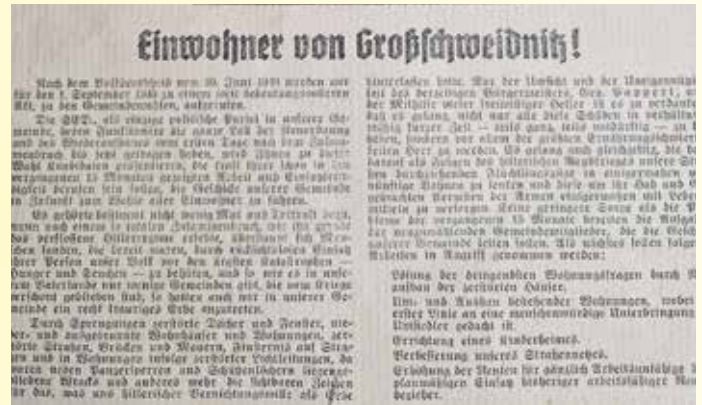
Fortsetzung der Geschichte Kommunalverwaltung Großschweidnitz