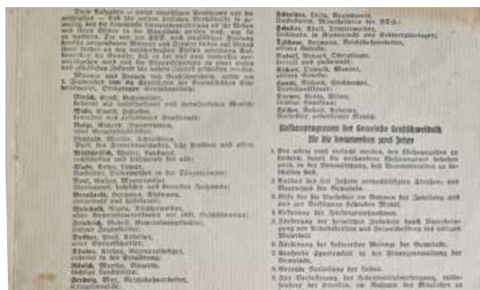
Kandidaten für Gemeinderat 1946

Um die öffentliche Ordnung wiederherzustellen, erließ der Gemeinderat in den Jahren bis 1949 verschiedene Ortsgesetze und Ortsatzungen. Mit der Gründung der DDR wurde die Arbeit der Gemeinde zentral – unter anderem durch Richtlinien über die örtlichen Volksvertretungen – geregelt. Zur Aufrechterhaltung der Ordnung und Sauberkeit erließ der Gemeinderat entsprechende Ordnungen. So enthielt eine Ordnung aus dem Jahr 1969 beispielsweise Rege-