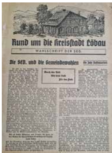
Wahlwerbung SED 1946