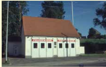
Altes Feuerwehrdepot mit Fahrzeugen