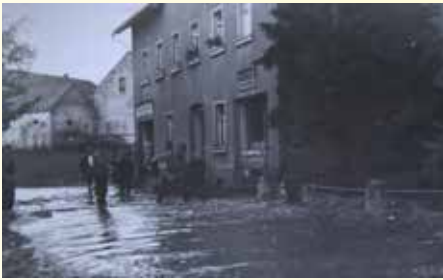
Im Einsatz bei einer Überschwemmung

allgemeine Öffnungszeiten der Gemeindeverwaltung: Mi. 08.00 Uhr – 12.00 Uhr und 13.00 – 18.00 Uhr, Do.: 08.00 Uhr – 12.00 Uhr und 13.00 – 17.00 Uhr, Mo., Die. und Fr. geschlossen