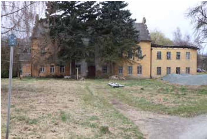
Lamm- oder Obermühle im heutigen Zustand

Nach ihm wurde die Mühle später auch als die „Lamm-Mühle“ bezeichnet.