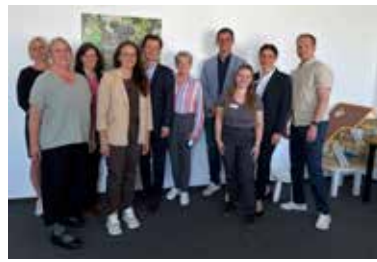
Gemeinsamer Besuch der Beratungsstelle für seelische Gesundheit von Kindern und Jugendlichen in Zittau.

Mit der Beratungsstelle entsteht im Landkreis Görlitz ein niedrigschwelliges und wohnortnahes Unterstützungsangebot für Kinder und Jugendliche, die erste emotionale oder soziale Auffälligkeiten zeigen, mit der medizinischen Kompetenz des Sächsischen Krankenhauses Großschweidnitz und des Universitätsklinikums Carl Gustav Carus Dresden im Rücken. Ziel ist es, betroffenen Familien frühzeitig Hilfe anzubieten – bevor sich Probleme verfestigen und eine intensivere kinder- und jugendpsychiatrische Behandlung erforderlich wird.