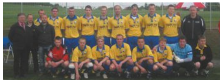
Auswahlmannschaft Fußballverband Oberlausitz

Erzgebirge Aue; Aufstellung einer Tafel mit Hochwasser-Bildern aus den geschädigten Vereinen und Spendenurne