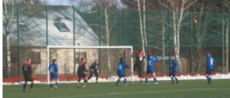
Unsere Abwehr steht bei einem Nieskyer Eckball gut.