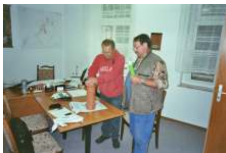
Beim abdichten des Zeitdokumentes

Im Zuge der Bauarbeiten am Gemein- dezentrum Großschweidnitz wurde vor der Fertigstellung der Treppe am Vor- dereingang des Gebäudes eine Art Urne aus einem KG-Rohr, als Zeitdokumenten eingebracht. Die Dokumente wurde in Folie eingebracht und mit Silikon verschlossen, um Sie für die Nachwelt zu erhalten. Vielleicht wird sie bei erneuten Baumaßnahmen dort gefunden.