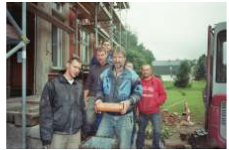
kurz vor dem Einbringen unter der Treppe

Aktuelle Ortsblätter, das Landkreisjour- nal, Dokumente der 20-jährigen Part- nerschaft mit der Gemeinde Klosterlech- feld, Fotos u.ä. wurden dabei hinterlegt.